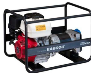
EA6000 / AVR