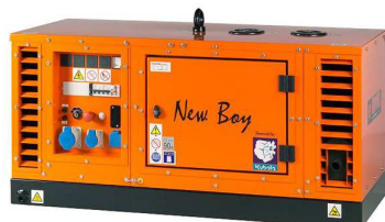
EPS113TDE / EPS183TDE