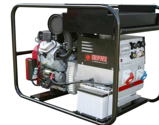
EP250XE / 300XE