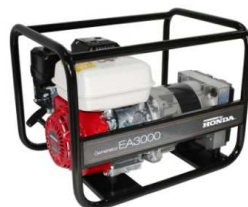
EA3000 / AVR