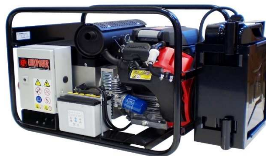
EP13500TE/TE AVR EP16000TE/TE AVR EP18000TE/TE AVR