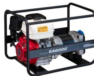
EA6000 / AVR