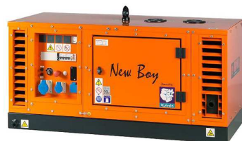
EPS113TDE / EPS183TDE